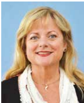
Inge Losch-Engler Bundesvorsitzende